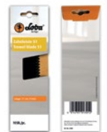
Blade til limrive