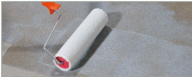
ARDEX P 51 er ideel som vandhæmmende grunder på gipsunderlag

Med til valget af storformatfliser følger som regel et ønske om de smallest mulige fuger. Fugebredden kan dog ikke kun vælges ud fra æstetiske aspekter, da man også skal tage hensyn til de byggetekniske krav. Udover de æstetiske overvejelser tjener fugningen også til at sikre en lang holdbarhed af de keramiske belægnin-