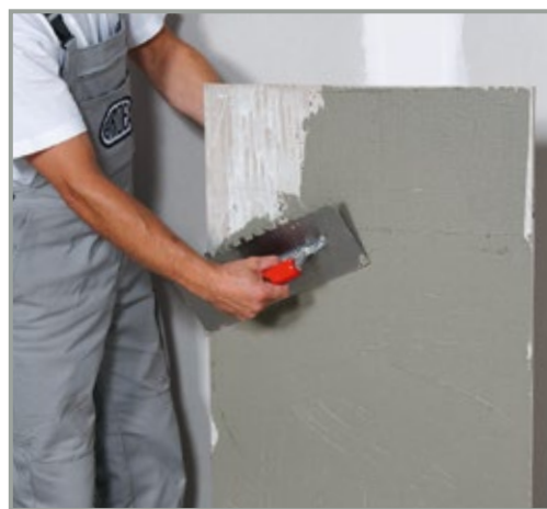
ARDEX X 78 MICROTEC og buttering-floating giver en forbedret klæbeevne.

Takket være gode selvnivellerende egenskaber giver ARDEX K 39 (tynde lag) og ARDEX K 75 (tykke lag) et optimalt plant underlag til lægning af storformatfliser og -natursten.