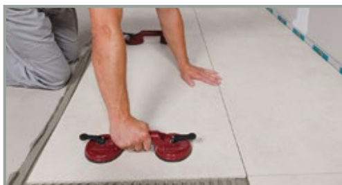
Mere sikkerhed: Det rigtige værktøj letter håndteringen og monteringen af storformatfliser.

Du er også velkommen til at kontakte os på tlf. 4488 5050. Spørg efter teknisk afdeling. De sidder klar til at dele ud af deres erfaringer.