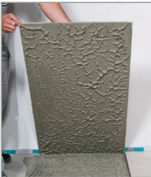
Med ARDEX X 78 MICROTEC opnås en hulrumsfri og fuldfladig klæbning.

metode bliver fliseklæberen ikke kun påført underlaget, men også på fliserens bagside. Afhængig af fliseformat påføres et tyndt eller tykkere lag på hele fladen. Klæberen skal påføres i samme retning på både flise og gulv. Jo grovere flisebagsiden er, desto vigtigere er det at anvende dobbeltklæbningsmetoden for at hindre dannelse af luftbobler og dermed hulrum under fliserne. Til dette er MICROTEC klæberen ARDEX X 78 ideel. Den er specielt udviklet til klæbning på gulv og forener fordelene fra en letflydende fliseklæber med egenskaberne fra en flexklæber.